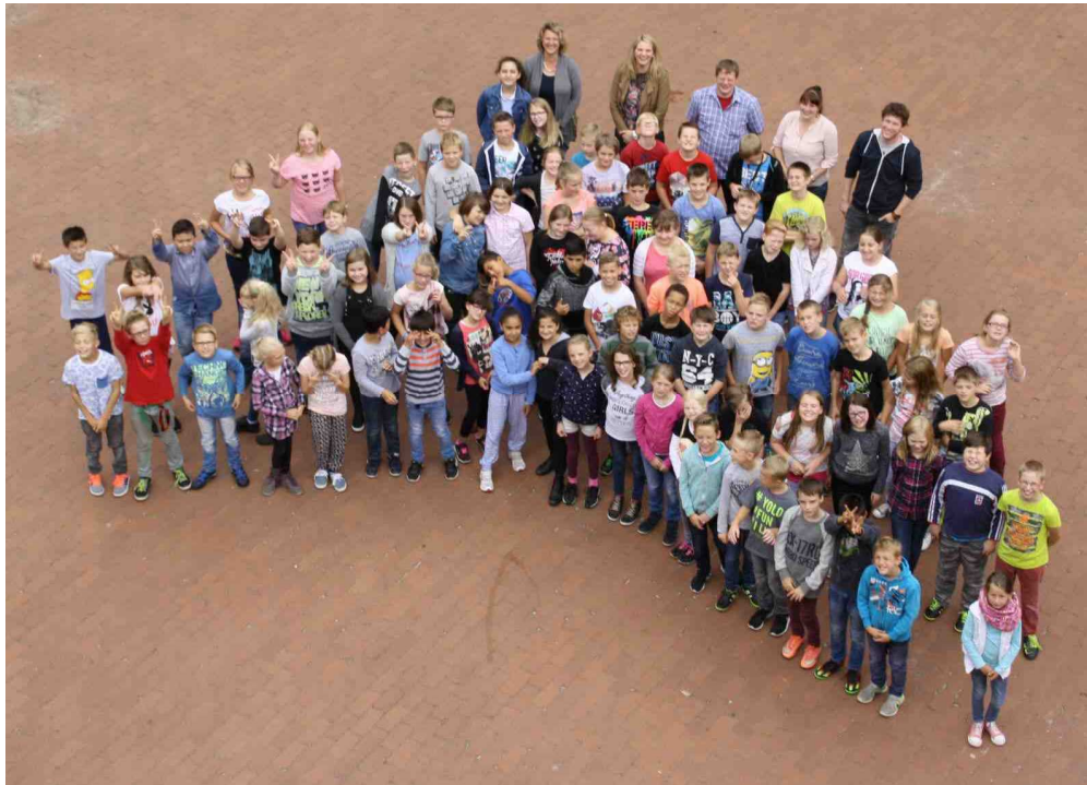
Unsere Neulinge der Klasse 5 mit ihren Klassenlehrern und Betreuungskräften